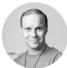
Jarkko Lahti näyttelijä