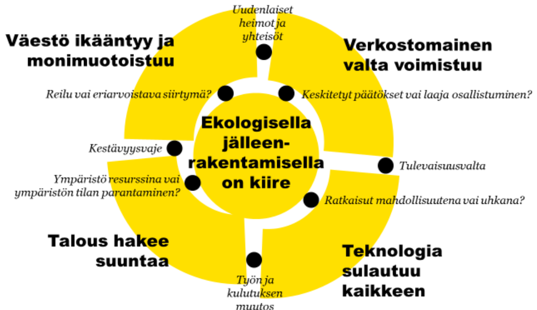
Kuva 1. Megatrendien kokonaiskuva

Ekologisen kestävyyskriisin tarkasteleminen suhteessa muihin tulevaisuuden kehityssuuntiin avaa hyvin megatrendien keskinäisiä jännitteitä. Ensimmäinen jännite liittyy tasapainoiluun nopeiden päätösten ja osallisuuden ja demokratian vahvistamisen välillä. Tilanteen tekee haastavaksi valtasuhteiden monisolmuistuminen, eli vallan määrittäminen verkostoissa, muun muassa taloudellisen, teknologisen ja kulttuurisen vuorovaikutuksen määrän suhteen. Yhteiskuntajärjestelmät ovat koetuksella sen suhteen, mikä niistä tarjoaa parhaimman tavan vastata ekologiseen kestävyyskriisiin ja monimutkaisen maailman haasteisiin. Osa kokee demokratian liian hitaaksi ja etäiseksi tavaksi päättää asioista tilanteessa, jossa aika loppuu kesken. Globaalilla tasolla vahvojen johtajien toivotaan tuovan yksinkertaisuutta hämmäntävään tilanteeseen, mutta toisaalta myös ruohonjuuritason vaikuttaminen on nousussa.